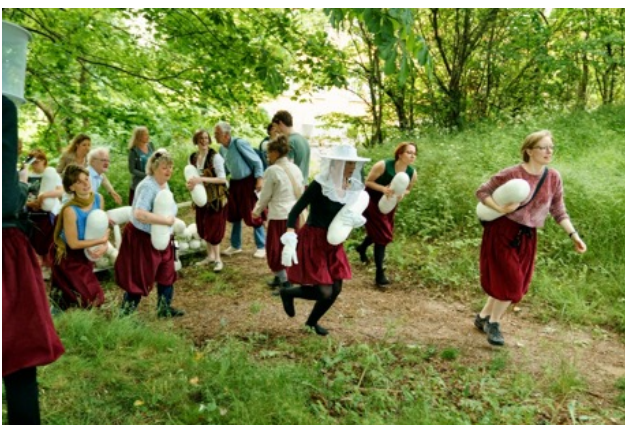
I 'Banket for bier' dykker gæsterne ned i biernes glæder og udfordringer.

Begge steder bliver der foretaget klimabevidste valg, når det handler om transport og fødevarer. Filosofien er at der købes lokale råvarer med stor fokus på at undgå madspild. Madrester bruges til nye retter. Der bliver sjældent brugt kød og i fald er det fra lokale, fritgående dyr. Christine lærer de unge volontører på Earthwise tricks for at leve mere i overensstemmelse med den levende verden og årstidens ressourcer. De er nyligt gået fra at bruge kikærter til i stedet den gamle danske sort Ingridærter – groet i Danmark, og langt billigere. På samme måde ser de madvarer efter 'i sømmene' – eller rettere, ser på deres rejse, fra produktionssted til hylder og bord. For tiden øver de sig på at spise årstidens grøntsager HELE året. Allerede fra april kan dette suppleres af vilde planter, der gror frem – skvalderkål, mælkebøtte, brændenælde. Ja, denne tilgang tager mere tid. Men den er også utroligt givende – nærende, ikke bare i maven. Arbejder man i en by, er udfordringen det større. Men der er jo flere og flere muligheder nu for kollektivt at få mad direkte fra bonden til kunden. Hvis bare flere små, mellemstore og større organisationer ville benytte sig af disse.